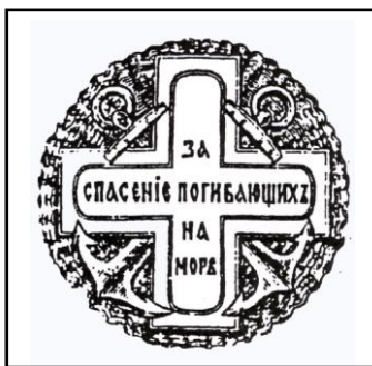
Medal „Za ratunek ginącym na morzach”

Jak mówi sprawozdanie z działalności za rok 1894, Towarzystwo otrzymało nowy kilkupiętrowy gmach, w którym znajdowały się pomieszczenia dla władz, sale wykładowe oraz magazyny na sprzęt ratowniczy. Wydawało też centralny biuletyn pt. „Ratunek na wodach” (oryg. nazwa: „Spasaniye na wodach”), w którym zamieszczane były roczne sprawozdania z działalności oraz informacje o ważniejszych wydarzeniach z życia organizacji. Ponadto Zarząd Główny prowadził szczegółową kronikę wypadków i akcji ratowniczych, a było ich wiele.