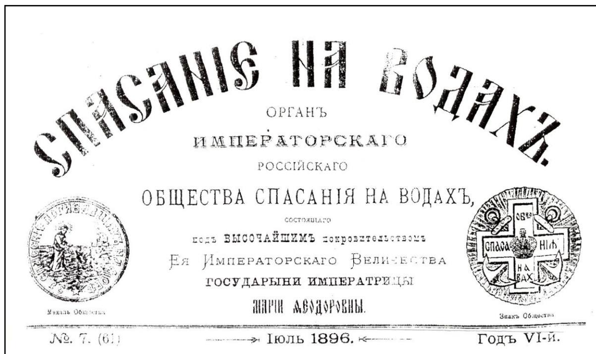
Strona tytułowa biuletynu „Ratunek na wodach”

Tak więc, jak na owe czasy, Towarzystwo było stowarzyszeniem doskonale zorganizowanym, sprawnie działającym i dobrze wyposażonym. Jego członkowie z poświęceniem wykonywali swoje obowiązki.