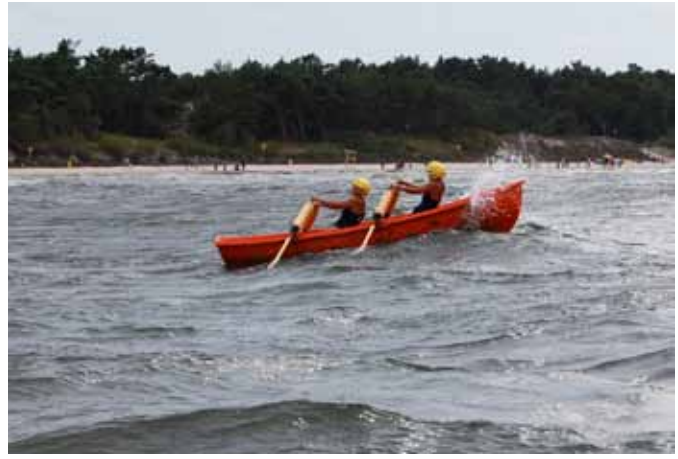
Łodzią wiosłową na fali, mocne wrażenia