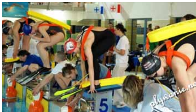
Start do holowania z węgorzem