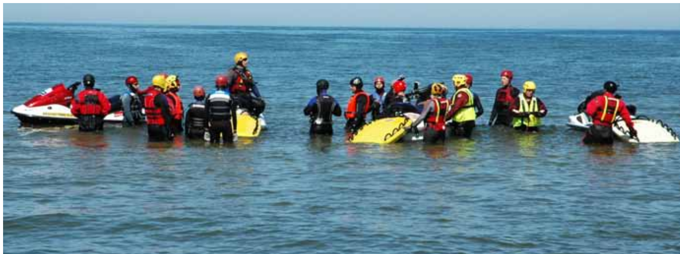
Szkolenie na skuterach wodnych w Rowach