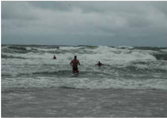
Warunki zawodów były bardzo wymagające