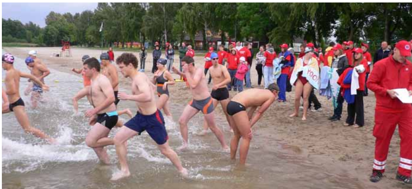
Kurs ratowników w Dąbrowie

Wzorem lat ubiegłych zorganizowano następujące specjalistyczne szkolenia finansowane lub współfinansowane ze środków centralnych WOPR: