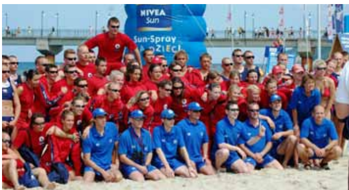
Przed rozpoczęciem zawodów