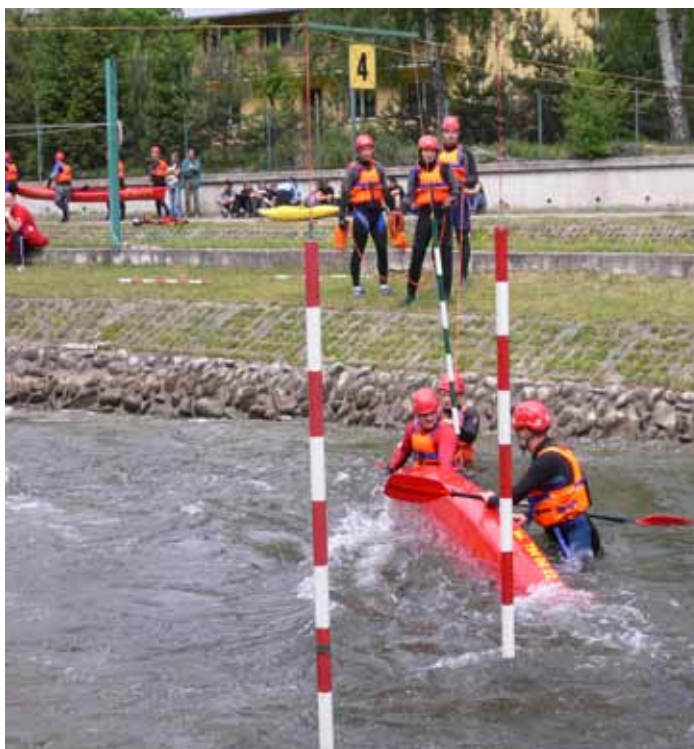
Ćwiczenia ze sprzętem na wodach szybko płynących