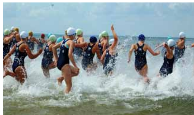
Start do pływania w morzu

ratowniczeki z Ustronia Morskiego IMPERIAL przed drużyną Dąbki Wielkopolska i Świnoujście, wśród mężczyzn najlepsi okazali się ratownicy z Jarosławca, pokonując reprezentację Świnoujścia i Ustki.