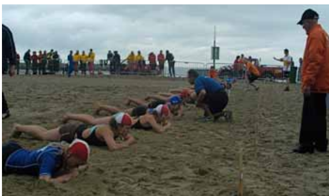
Przed startem do wyścigu po chorągiewki ME