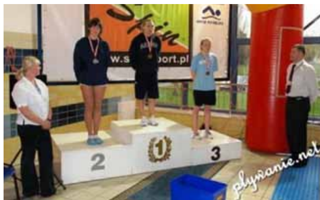
Mistrzynię na „pudle”