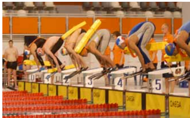
Start do holowania z węgorzem ME Holandia ,08