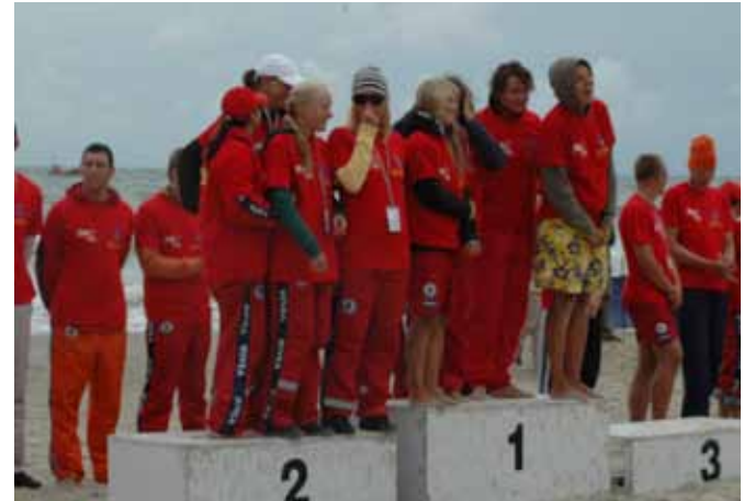
Mistrzyni na podium