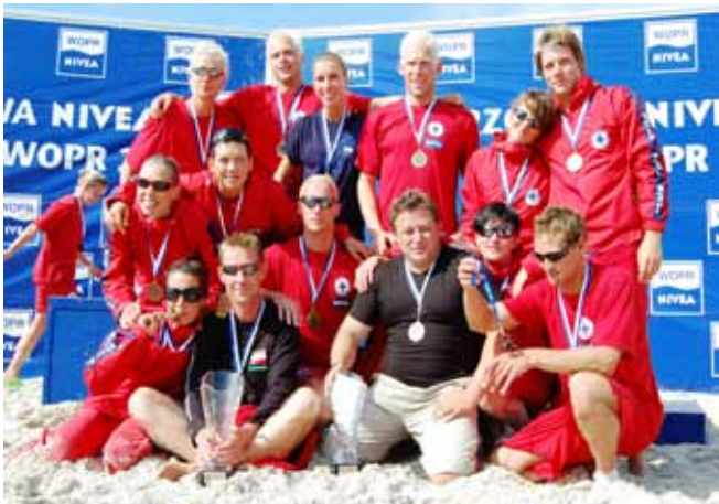
I.... po zawodach